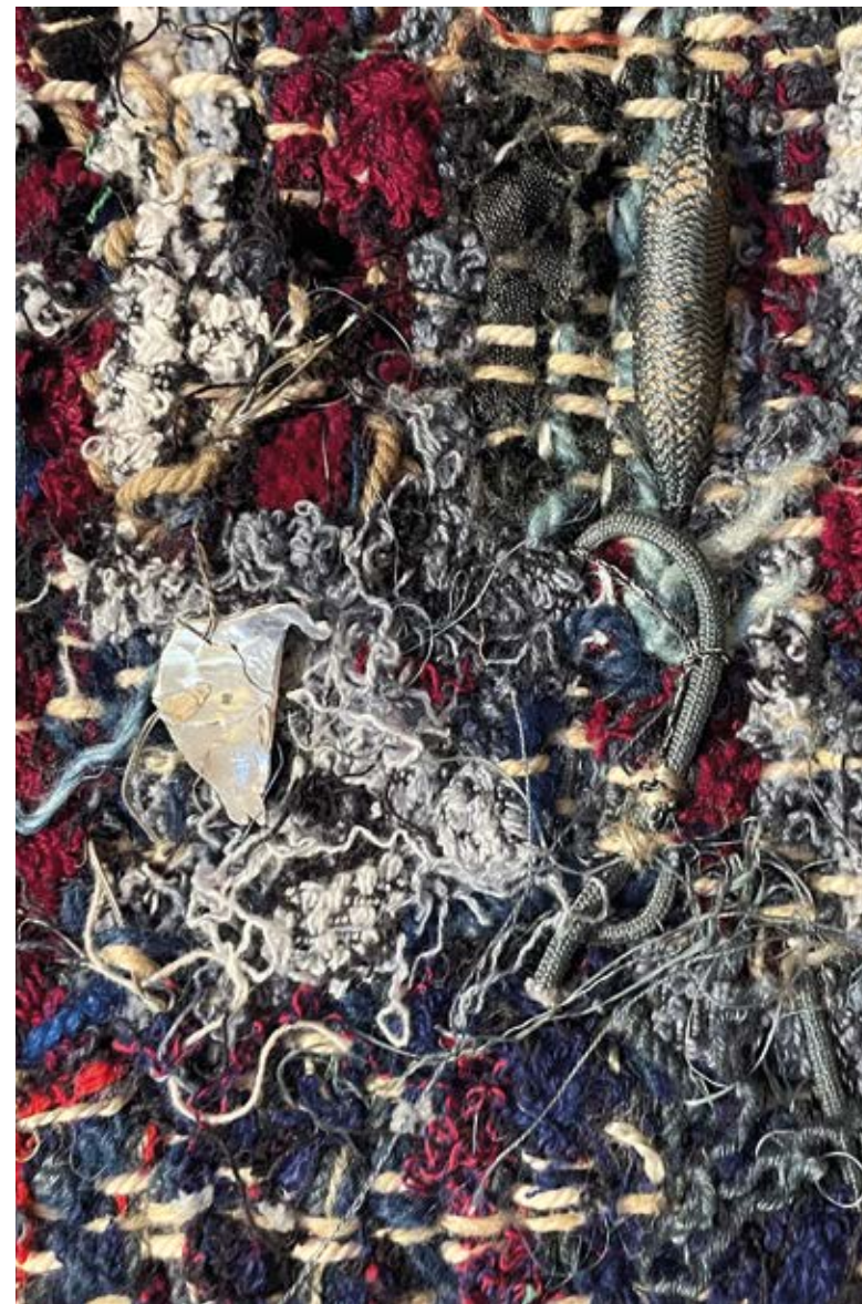
Detalj, Havbotn , 1973, billedvev, 177 x 154 cm.