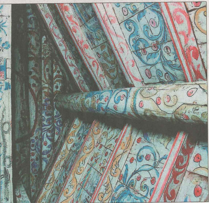
VITALITET: Dei moderne kunstnarane såg etter råskapen og vitaliteten i bygdekunsten. Raunsgarstugu på Hol bygdamuseum.