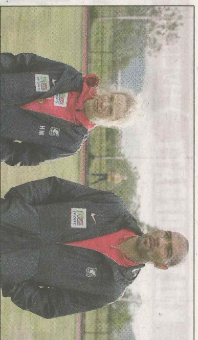
Nesten en halv million mennesker benket seg foran TV-skjermen da sesong to av den kritikerroste NRK-serien «Heimebane» hadde premiere søndag kveld på NRK 1.