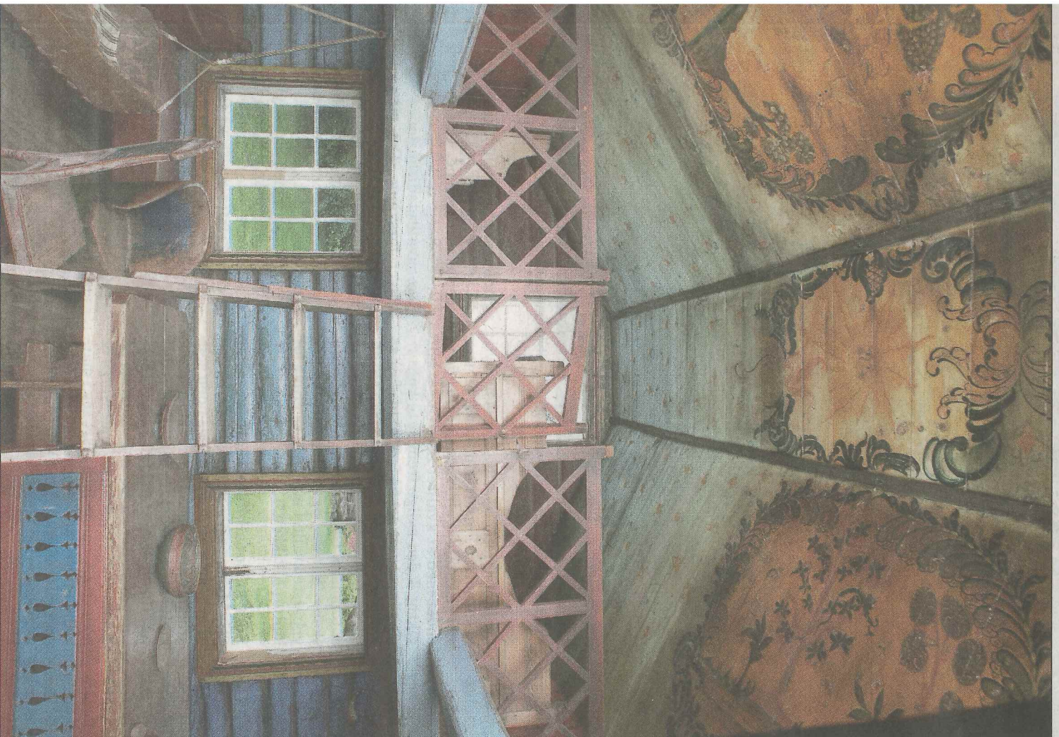
terieret i Torpostua er malt av Emrik Bæra (1788–1876). Fotografet vises i utstillingen, men bygningen er på Arhusmuseet like utenfor utstillingsbygningen.