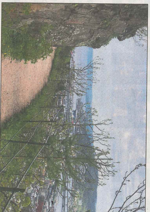
THURMANNNS VEI: Turene i og rundt Thurmanns vei forfører i sannhet noen ukler i sus og dus.