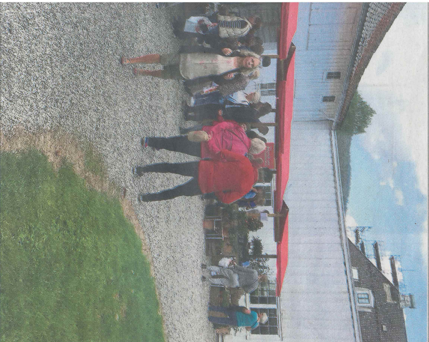
I HELGEN: Nå blir det hagedag på Drammens Museum igjen. Her fra fjordrets arrangement.