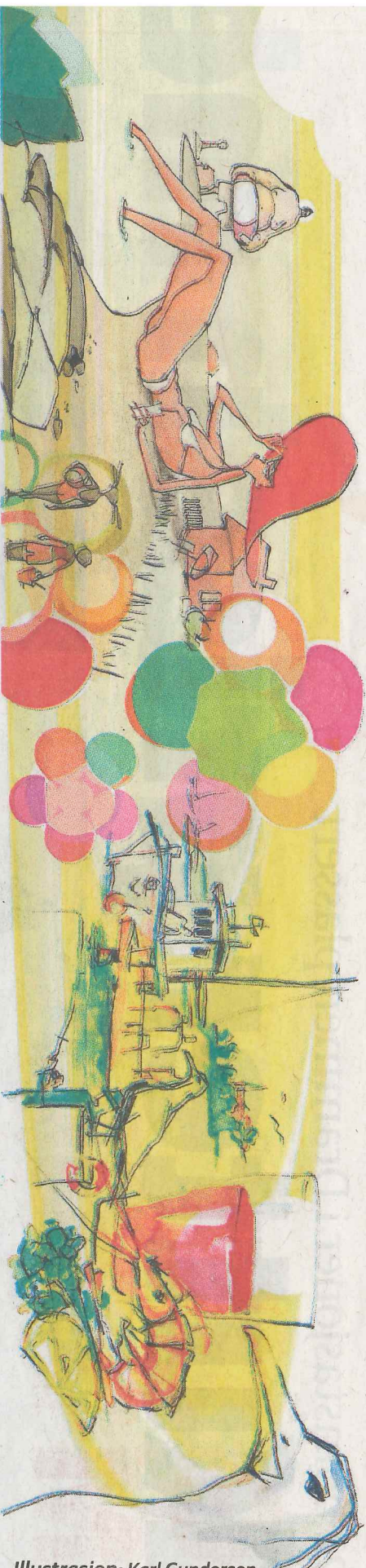
Illustrasjon: Karl Gundersen