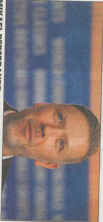
MIKAEL PERSBRANDT: Selvbioografi kommer snart ut i norsk oversettelse og skuespilleren legger turen innom Norge for lanseringen.