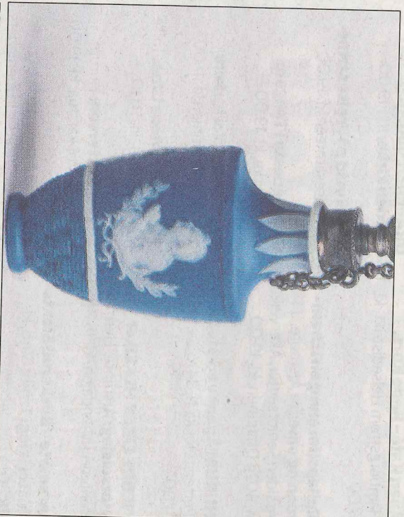
FAVORITTEN: Nancys favoritt er en luktevannsfleske fra 1700-tallet, en av 519 gjenstander som er stilt ut i Drammens Museums nye utstilling.