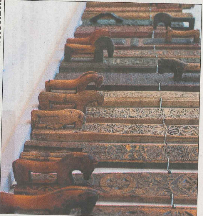
VARIASJON: Museet har mange mangletrær i sine samlinger, og et bredt utvalg vises på utstillingen «Fra tutekanne til silkebroderi».

skam. Fra anmelderhold har det vanket mange godord, og kritikeren i Expressen kviterte blant annet med: «Mikael Persbrandt er ikke nådig mot seg selv. Skammen hans brenner gjennom fortellingen, og han unnskylder seg ikke». Her på berget blir det bokbad 15. februar - og det er altså Ari Behn som samtaler med Mikael Persbrandt.