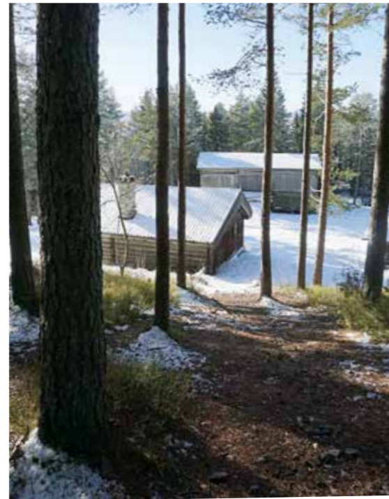
NUMEDALSTUNET på Bragernesåsen. Vi ser ryggen av den fredede Toenstua (t.v), med dekorasjoner av Thore Kravik i 1792. Toenstua er foreslått flyttet til Marienlyst i museets saksframlegg til fylkeskommunen (november -15).