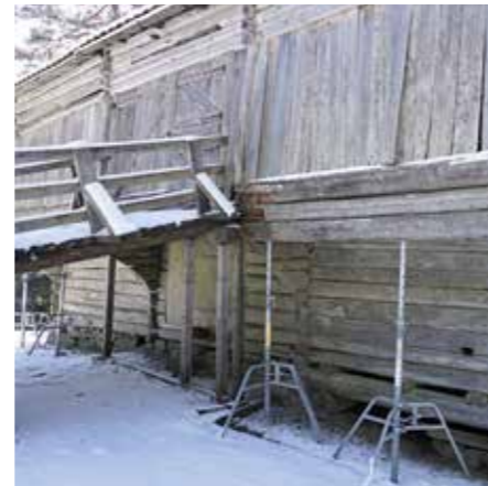
FORFALL: Denne treroms låven fra Straumen i Nore representerer den vanskeligste vedlikeholdsutfordringen på Bragernesåsen.

Thorkildsens argument om at museet har en for stor portefølje i forhold til ressursene har hun en viss forståelse